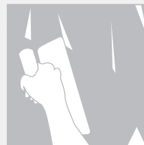
3. Aplicar segunda capa de Decopasta