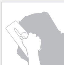
2. Aplicar Decopasta